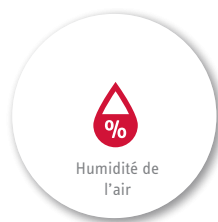
Humidité de l'air

La température de bien-être dans une maison ou un appartement se situe généralement entre 19°C et 23°C.