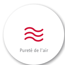
Pureté de l'air

À la maison, l'humidité de l'air optimale se situe entre 40 et 50%. Dans les pièces chauffées, elle ne doit pas descendre en dessous de 30% et ne doit pas dépasser 60%.