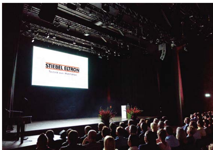
Le film de l'évènement: Histoire de STIEBEL ELTRON présentée

de la devise «joindre l'utile à l'agréable», cela été en même temps le coup d'envoi de différentes offres culinaires. Au sens d'un festival de Street Food, on a ainsi pu faire un voyage à travers la Suisse et se servir «en route», déguster un émincé à la zurichoise avec des rösti ou un risotto tessinois suivi pour ceux qui en avaient envie d'un filet de bœuf ou de macaronis à la montagnarde. Cela a donné naissance à un ensemble très hétéroclite, les interlocuteurs tout comme des places assises changeant au gré des envies. L'effervescence a perduré toute la soirée.