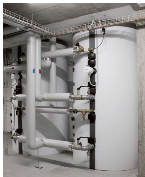
eau potable sans légionelles grâce au préparateur instantané: Le ballon d'eau chaude SBS 1501