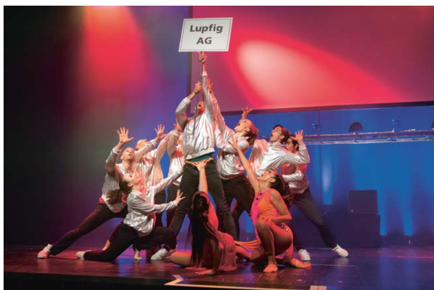
La Focus Crew Streetdance a généré la bonne humeur avec son spectacle