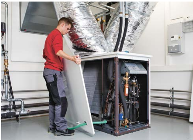
20 | Un entretien régulier dans le cadre de nos contrats de maintenance