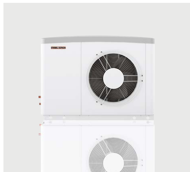
WPL 17 ACS classic