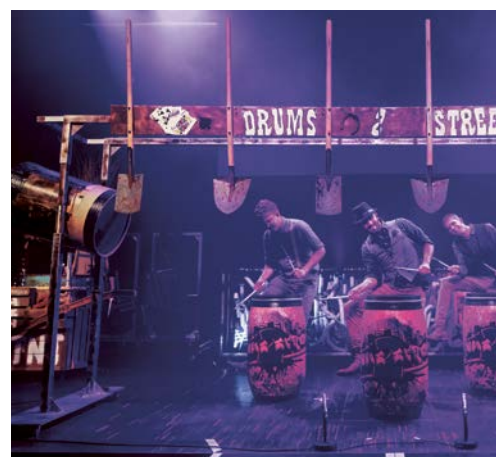
Drums2Streets ont dévoilé un show impressionnant