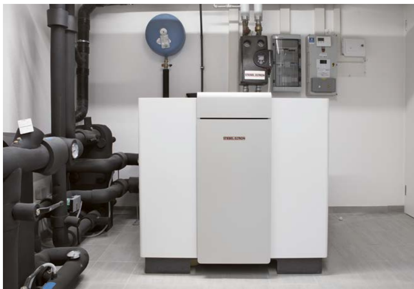
La pompe à chaleur eau | eau WPF 27

Même les ballons d'eau chaude installés attestent de la modernité des concepts. Les ballons SBS font pleinement valoir leurs atouts dans les espaces exigus. Parce qu'ils sont à la fois le ballon tampon et le préparateur instantané d'eau chaude. Ainsi, les échangeurs de chaleur hautes performances améliorent de surcroît l'hygiène dans le ballon, parce que seuls de faibles volumes d'eau potable doivent être préparés pour d'approvisionner efficacement la maison en eau chaude. À propos, également à partir de l'énergie solaire écologique: Grâce à l'échangeur de chaleur solaire dans le ballon, il est aisément possible d'intégrer d'autres sources d'énergie renouvelables. Ainsi, les ballons combinés s'affirment comme de véritables unités de puissance au sein de la chaufferie.