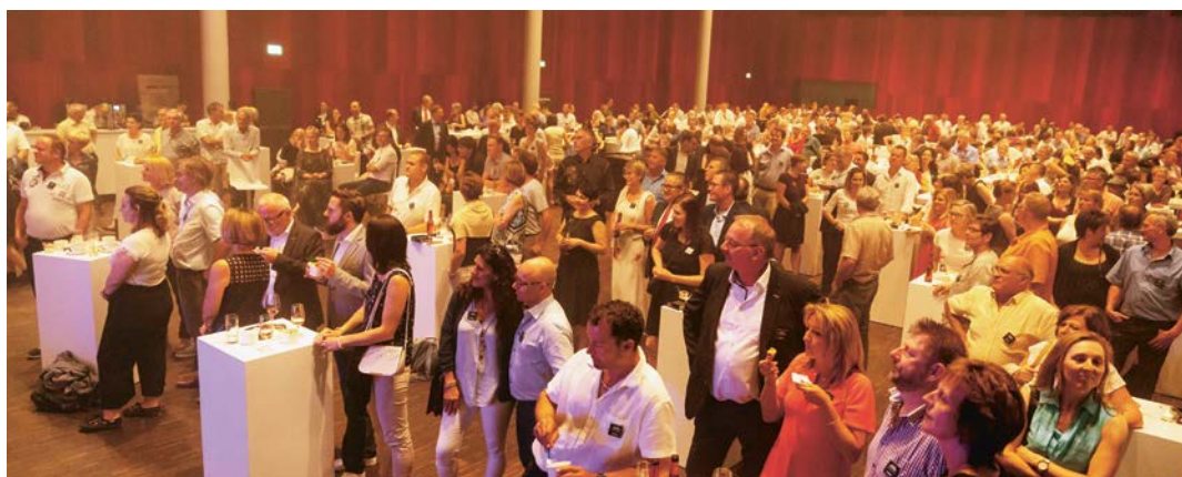
Un évènement de gala exceptionnel au Campussaal Brugg-Windisch

Comme souvent dans ce genre de soirées, on était heureux, après la partie officielle, de pouvoir se dégourdir les jambes. En vertu