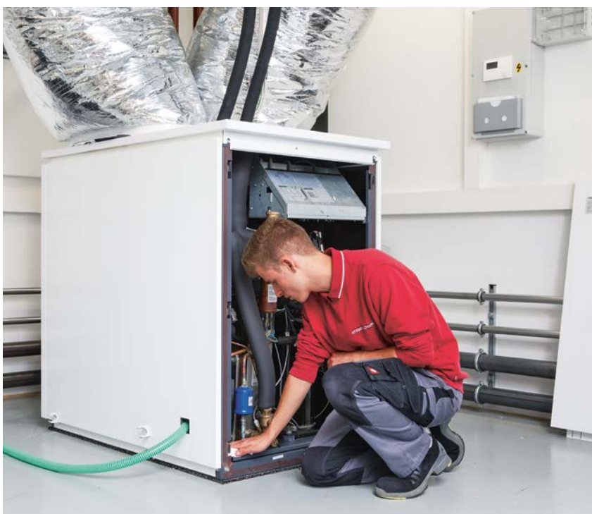
Technicien de maintenance en intervention