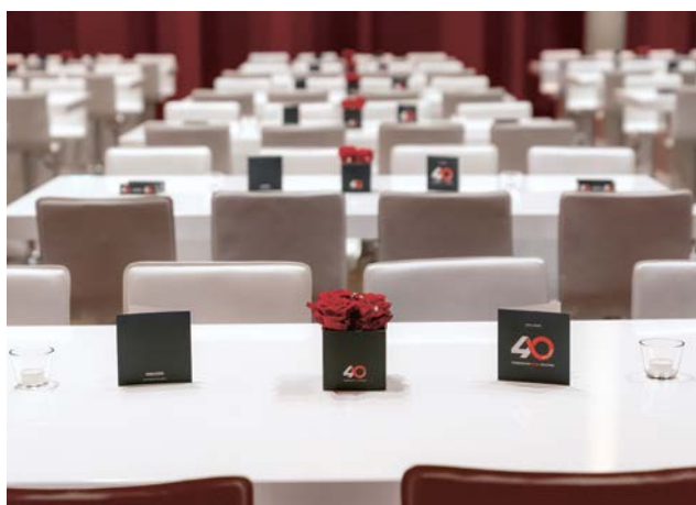
6 | Nous célébrons le 40e anniversaire de notre entreprise