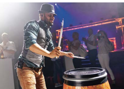
Le show de tambours a été un feu d'artifice de rythmes