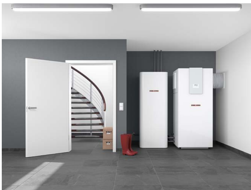
Le ballon intégral HSBC 300 cool est idéal pour la combinaison avec la WPL classic

Des solutions de détails importantes réduisent les opérations d'installation. Cela comprend le guidage flexible de l'air pour l'exécution «ICS», le module compact de guidage d'air pour l'exécution «IKCS» et les adaptateurs rapides au niveau des tuyaux d'air pour un montage rapide et propre. Le niveau d'intégration élevé autorise une installation simple, d'encombrement faible. Les amortisseurs de vibrations intégrés permettent le branchement direct aux raccords hydrauliques.