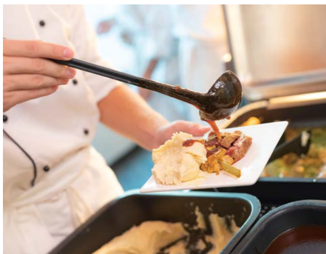
Les moments gastronomiques du festival de Street Food ont été très appréciés