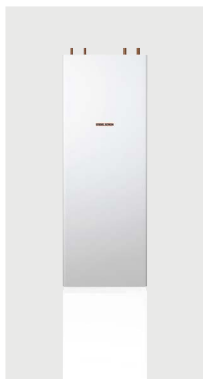
Ballon intégral HSBC 300 cool

Parfaitement adapté à l'utilisation avec une pompe à chaleur, le HSBC couvre tous les besoins d'une maison individuelle en matière de chaleur et d'eau chaude sanitaire et d'hydraulique. Et ce, dans un format des plus confortables. Grâce à la combinaison intelligente de l'eau chaude potable et du ballon tampon, l'encombrement est quasiment réduit de moitié, autorisant ainsi un montage dans les espaces les plus confinés. Il en résulte davantage de surface utile pour le propriétaire. Le ballon intégral HSBC constitue ainsi une excellente solution pour les maisons individuelles – notamment en interaction avec la WPL 17 classic.