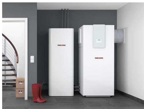
16 | Une équipe imbattable: WPL classic et HSBC 300