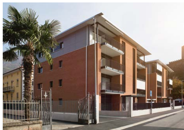
18 | La Villa Carmine a fait place à deux maisons pluri-familiales