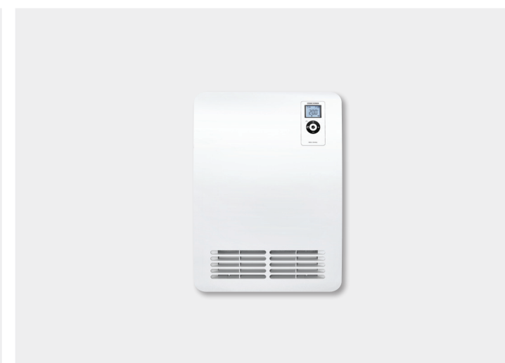
Premium CK 20 Premium