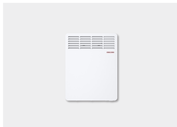
Trend CNS Trend U (Unplugged)

236545 - CNS 50 Trend U (0.5 kW) 236546 - CNS 75 Trend U (0.75 kW) 236547 - CNS 100 Trend U (1.0 kW) 236548 - CNS 150 Trend U (1.5 kW)