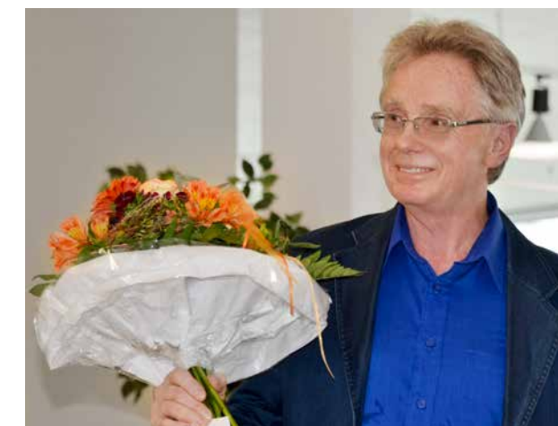
26 | Le plus ancien des collaborateurs fête 30 ans de maison