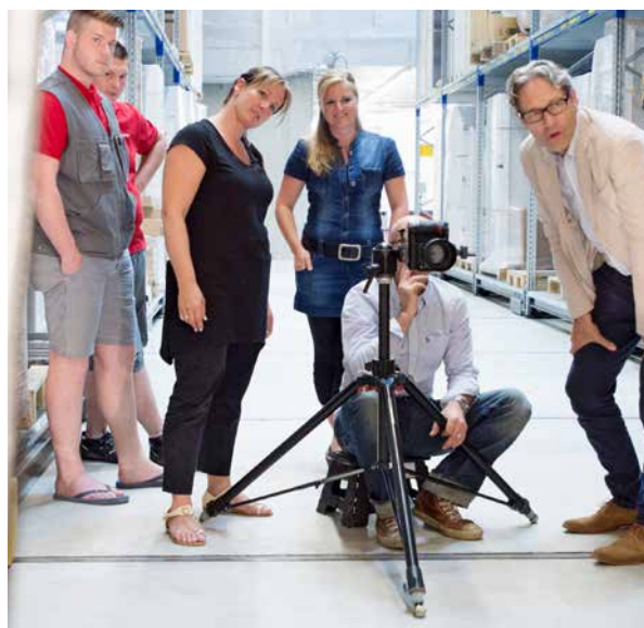
10 | Le Making-of