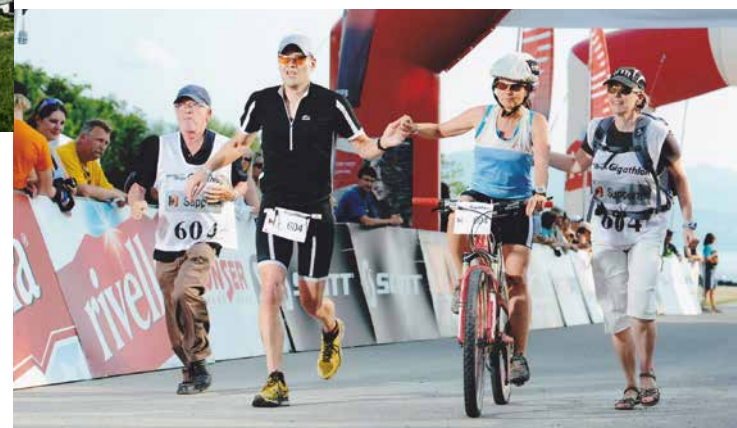
22 | La course des extrêmes