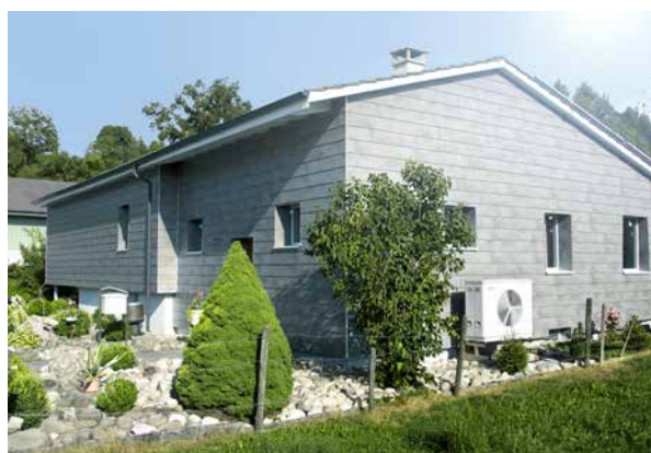
12 | Un investissement rentable