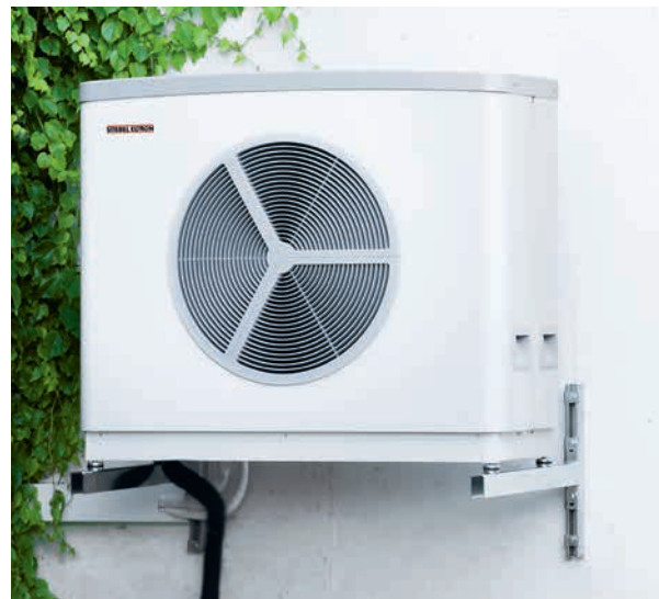
6 | Pompes à chaleur urbano-compatibles