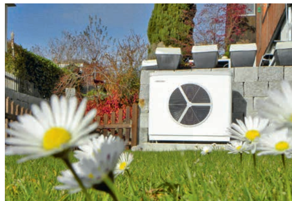
8 | Installation témoin à Affoltern am Albis