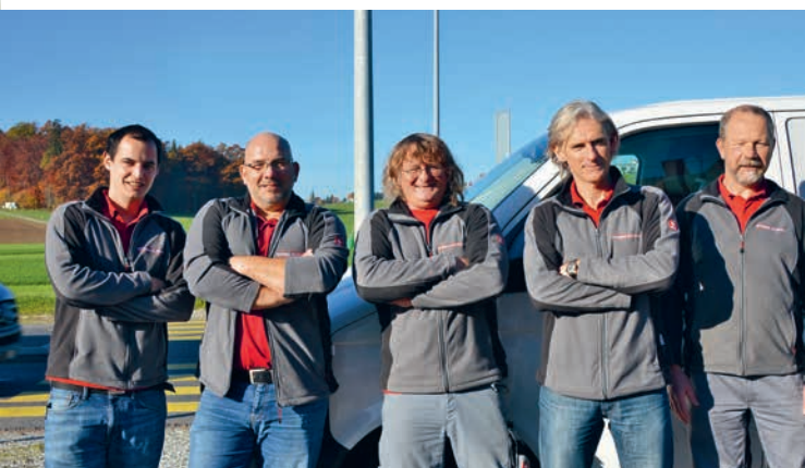
15 | Équipe de service à Matran