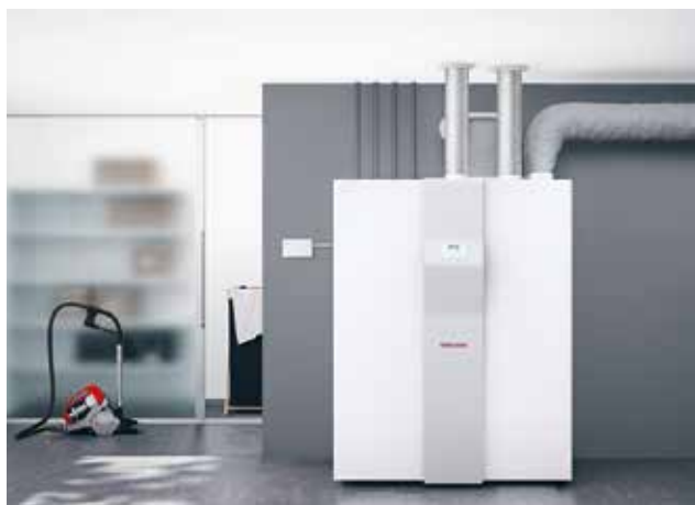
14 | Tecnologia di aerazione moderna