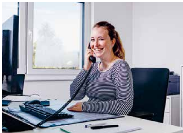
20 | Nuovo ufficio esterno a Egnach

I fortunati vincitori della nostra estrazione 23