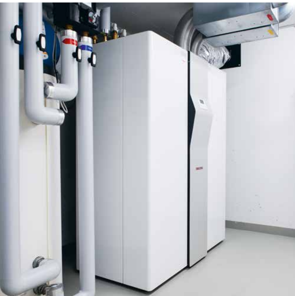
Perfettamente adatto per nuove costruzioni: LWZ 504