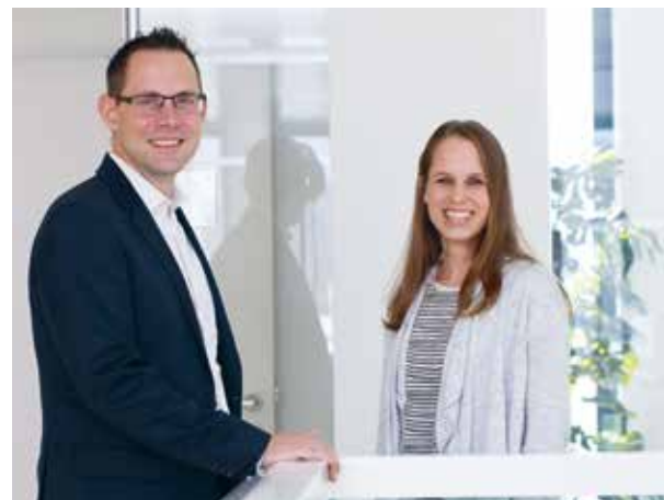
6 | Iniziativa HR: promozione della comprensione reciproca