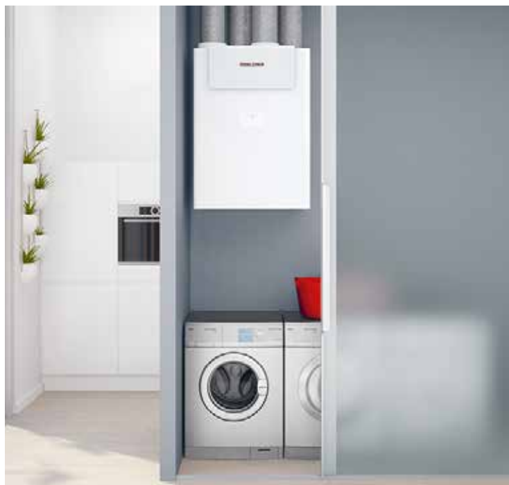
Aerazione Premium per maggiore comodità e minore perdita di energia: LWZ 180/280