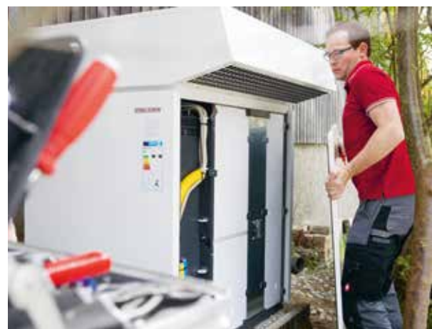
16 | Sostituzione di una pompa di calore