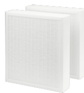
FMK F7-2 ZUL dez. 300