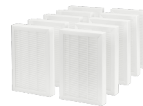
FMK F7-10 ZUL dez. 300