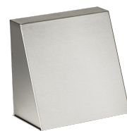
LTM TL 1230 BA VA E6B R2 S4 B