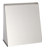
LTM TL 1230 BA VA E2B R2 B