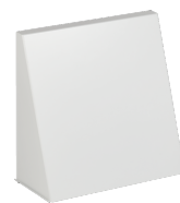
LTM TL 1230 BA VA E2W R2