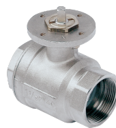
MKH 2-W DN50