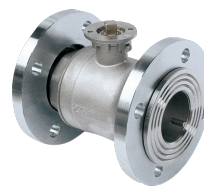
MKH 2-W DN65