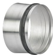
AS LWZ DN160