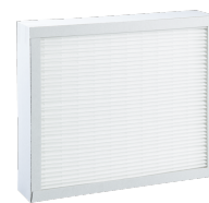
LTM dezent FMS F9-1