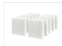
FMS M5-10 Estrazione aria dec. 800/870